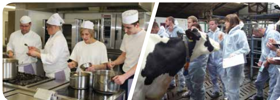
Schüler beim Kochen in der Großküche